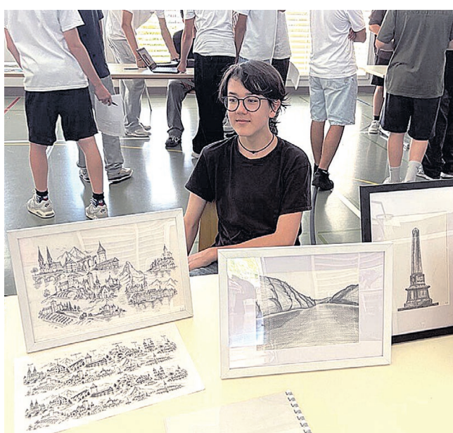
Von Hand gezeichnete Kantonsmotive – wahre Kunstwerke!