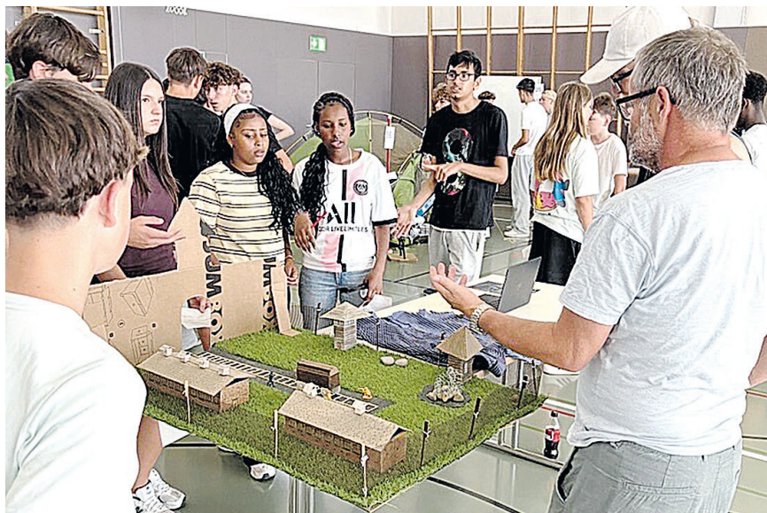
Vielbeachtet: Die Nachbildung des Konzentrationslagers Auschwitz.

Geschichts- und Gesellschaftsthemen waren ebenfalls gut vertreten. Schülerinnen und Schüler beschäftigten sich intensiv mit bedeutenden Ereignissen und Konflikten – darunter das Osmanische Reich oder der Konflikt zwischen Thailand und Kambodscha. Andere richteten