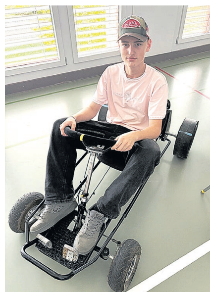
Ein Gokart für kontrollierte Drifts.