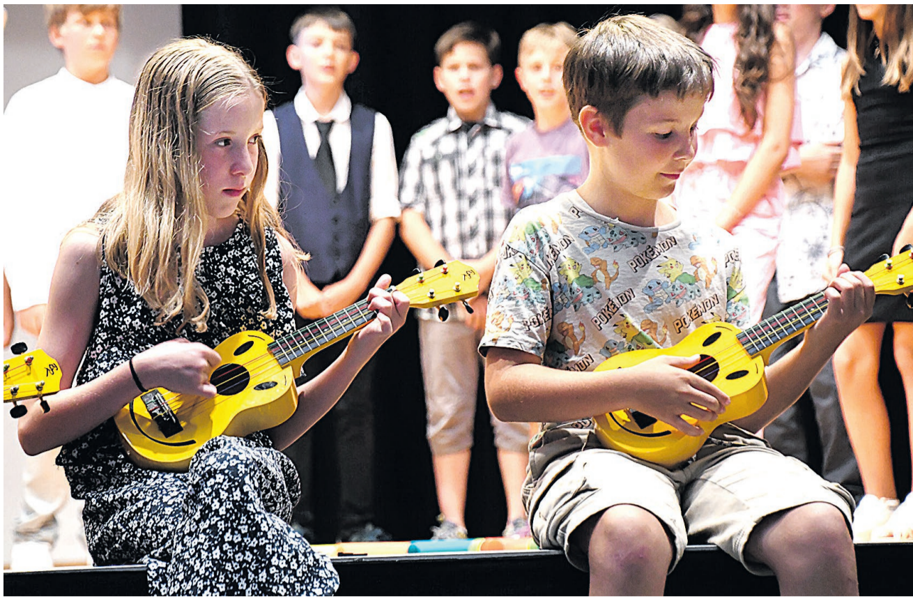
Die Primarschüler umrahmen die Schulschlussfeier mit zahlreichen Elementen; die Fünftklässler musizieren und singen zwei Lieder.