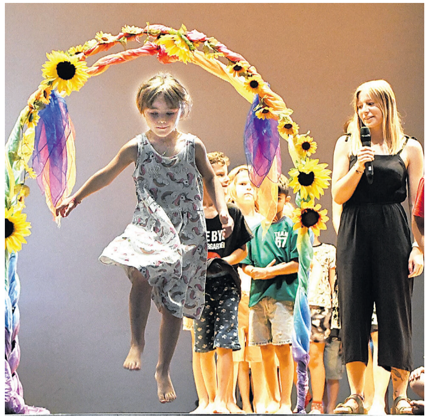
Der Moment ist da: Der ältere Jahrgang des Kindergartens springt auf die grosse Matte – und damit in die 1. Klasse.