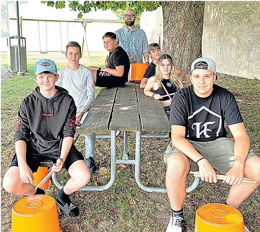
Bandprobe im Freien.