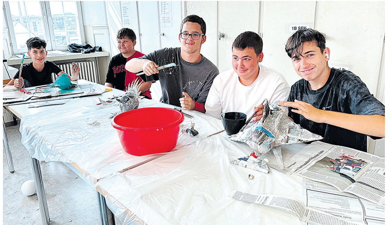
Das Dekoteam gestaltet Fische für das Fischernetz.