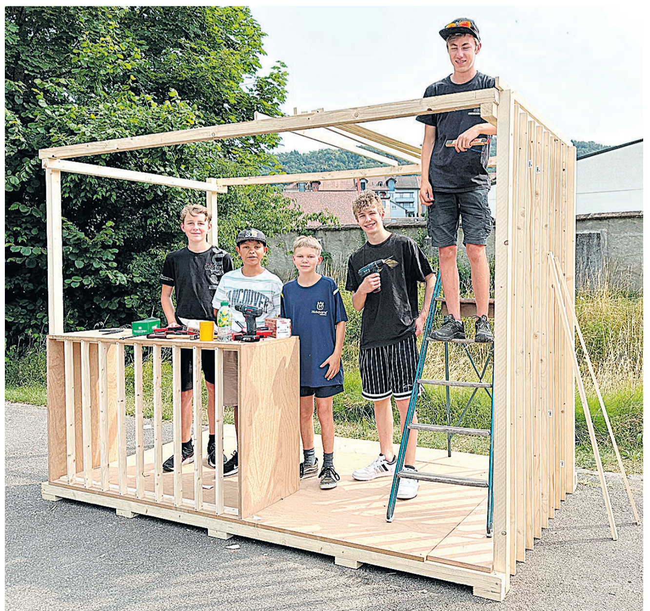
Ein Verkaufsstand entsteht.